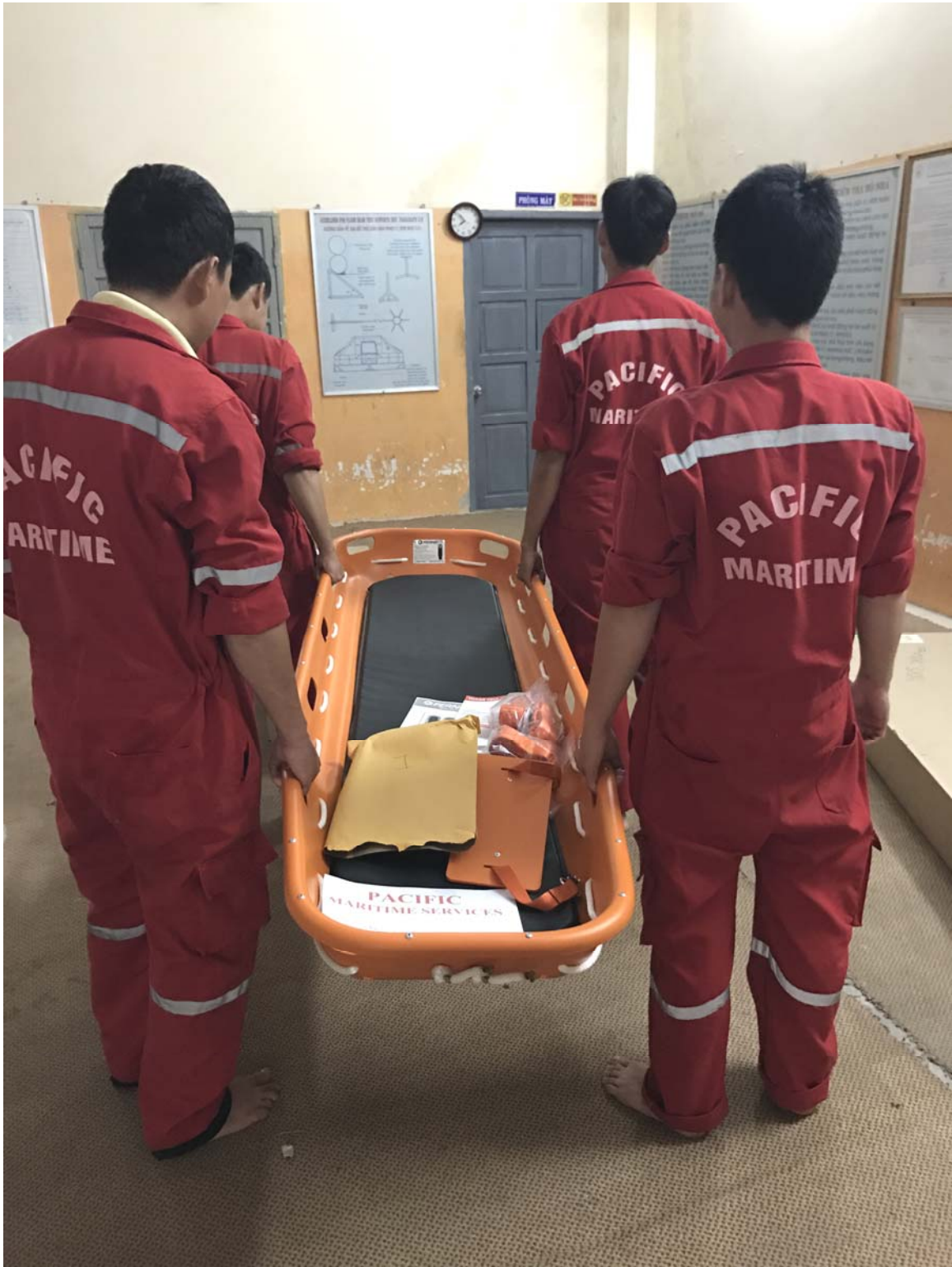
Hình 1: Cách sử dụng cang