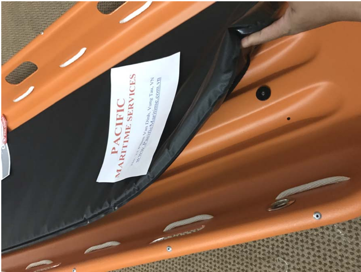
Hình 2: Miếng lót có thể thay thế