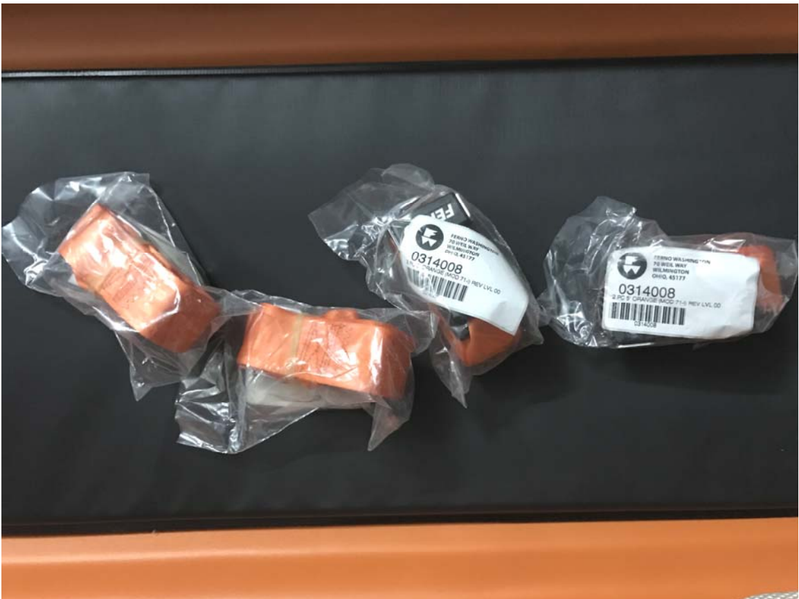
Hình 7: dây đai chằng bệnh nhân- 4 sợi