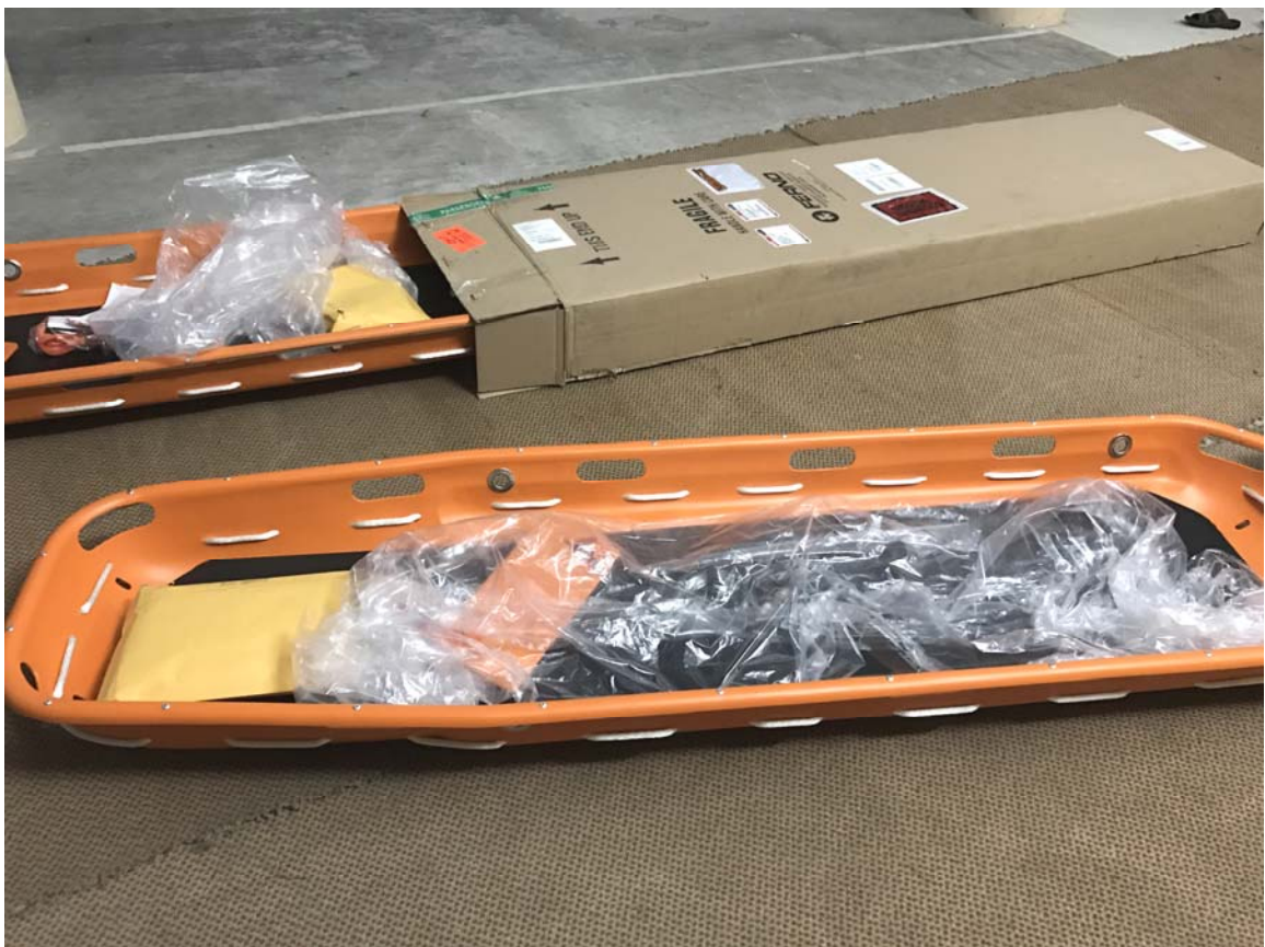
Hình 5: Quy cách đóng gói bằng thùng giấy kích thước 220cm (L) x 60cm (W) x 20cm(T)