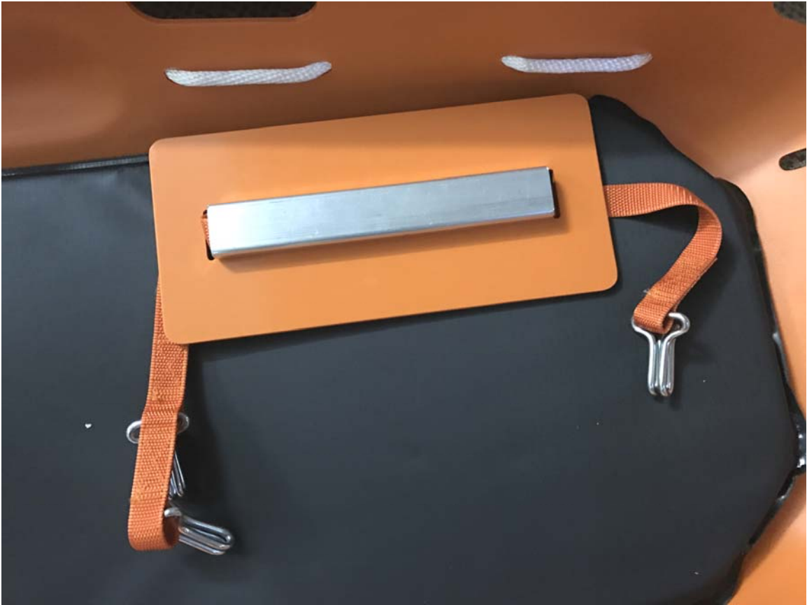
Hình 6: Tấm giữ chân